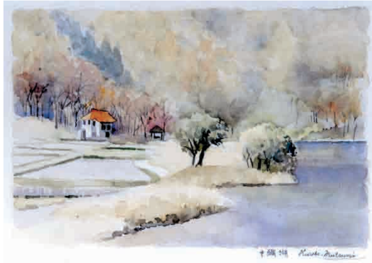
絵 湖畔 富山協立病院 黒部 むつみ

2013年 富山県保険医協会 1/25 富山市桜橋通り6-13、フコクビル11階 第349号 (076) 442-8000、FAX 442-3033 発行人 矢野博明 (年間購読料6,000円・一部500円)