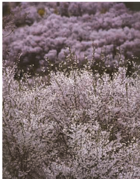
写 さくら田 柳瀬医院 柳瀬 茂満