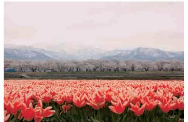
写 春満開 大菅歯科医院 大菅 明