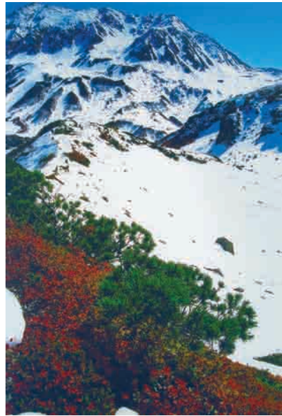
写 行く秋の立山 高野整形外科リウマチ科医院 高野 治雄