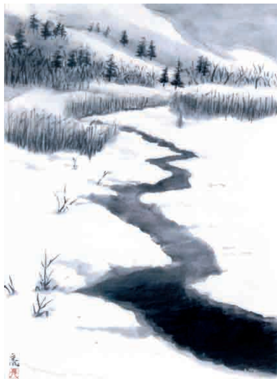
絵 自然の恵み 谷野呉山病院 草野 亮