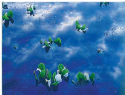
写 水芭蕉 片山歯科医院 片山 克己