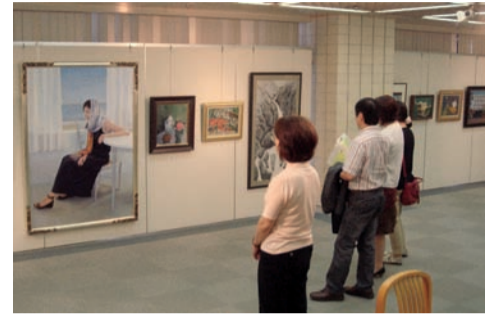
第32回保険医作品展(2011年6月・富山県民会館)