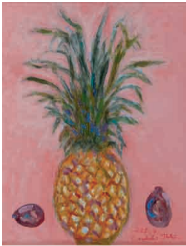
絵 果実 滝医院 瀧 邦彦