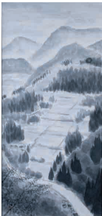
絵 山峡の道 谷野呉山病院 草野 亮