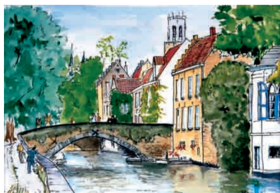
絵 ヨーロッパ紀行 水橋診療所 金崎 照雄