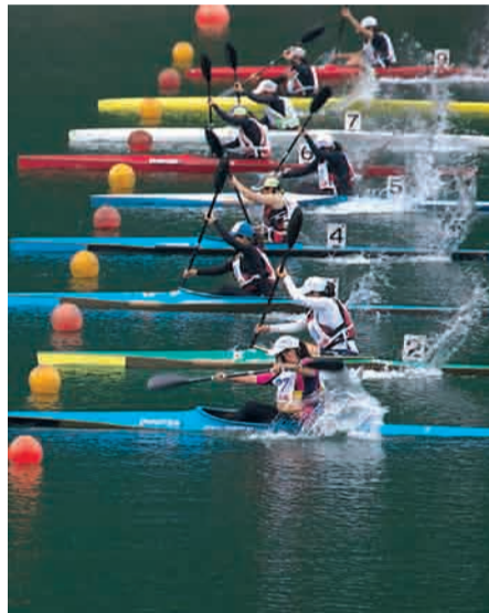
写 スタート 歯科魚津医院 魚津 博文