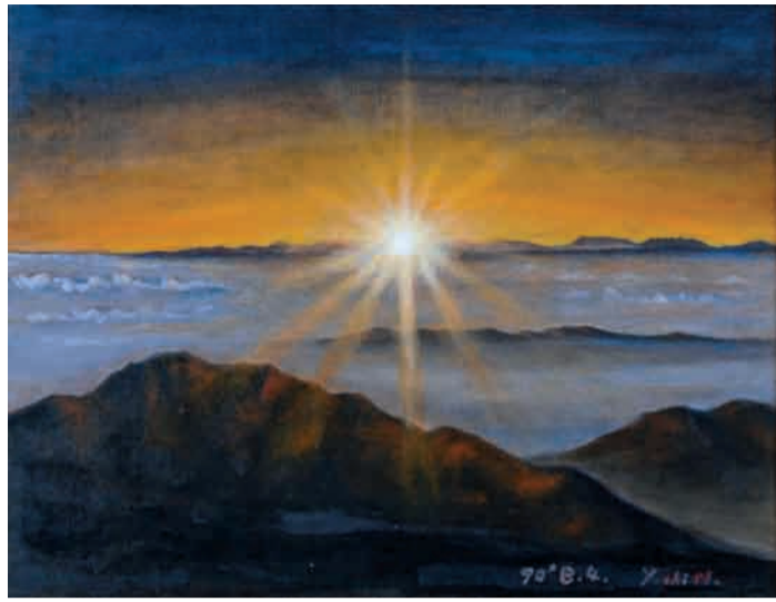
絵 白山・日の出 松田外科医院 松田 嘉之

2013年 富山県保険医協会 10/15 富山市桜橋通り6-13、フコクビル11階 第356号 電話 (076) 442-8000、FAX 442-3033 発行人 矢野博明 (年間購読料6,000円・一部500円)