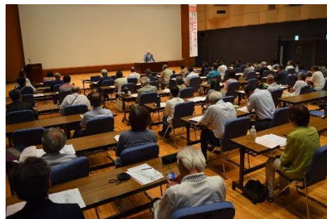
2019年8月「映画と被爆者の講演のつどい」 （今年はつどいの開催はありません）